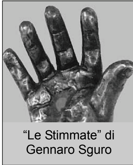
“Le Stimmate” di Gennaro Sguro

L'Associazione Internazionale di Apostolato Cattolico Aiac), presenta la IX edizione del Premio Internazionale “San Pio da Pietrelcina”, che si svolgerà mercoledì alle 16,30 presso il Club Megaris, in vicolo Strettolle delle Fiorentine a Chiaia, 14. La giuria del premio così composta: da Francesco Balletta, direttore del dipartimento di Analisi dei Processi Economico - Sociali dell'Università Federico II Napoli; da Giulio Tarro, presidente della